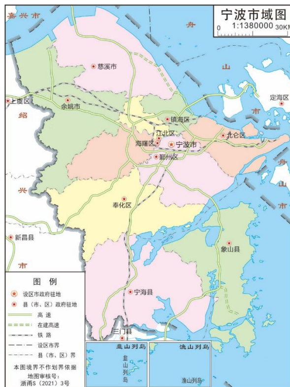
图 1-1 宁波市行政区划图

余姚 2 个县级市，有 73 个镇、10 个乡、73 个街道办事处、754 个居民委员会和 2169 个村民委员会。全市陆域总面积 9816 平方公里，其中市区面积为 3730 平方公里；海域总面积为 8355.8 平方公里根据 2018 年海岸线动态监视监测数据，岸线总长为 1678 公里，约占全省海岸线的四分之一。全市共有大小岛屿 611 个，面积 277 平方公里。根据第七