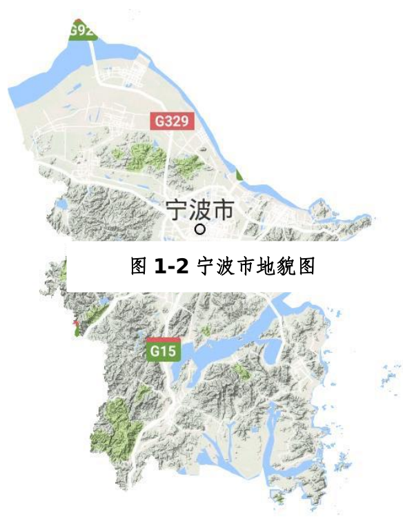
图 1-2 宁波市地貌图

宁波有漫长的海岸线，港湾曲折，岛屿星罗棋布。全市海域总面积为 8232.9 平方千米，岸线总长为 1594.4 千米，约占全省海岸线的 24%。全市共有大小岛屿 614 个，面积 262.9 平方千米。宁波境内有两港一湾，即杭州湾、北仑港和象山港。