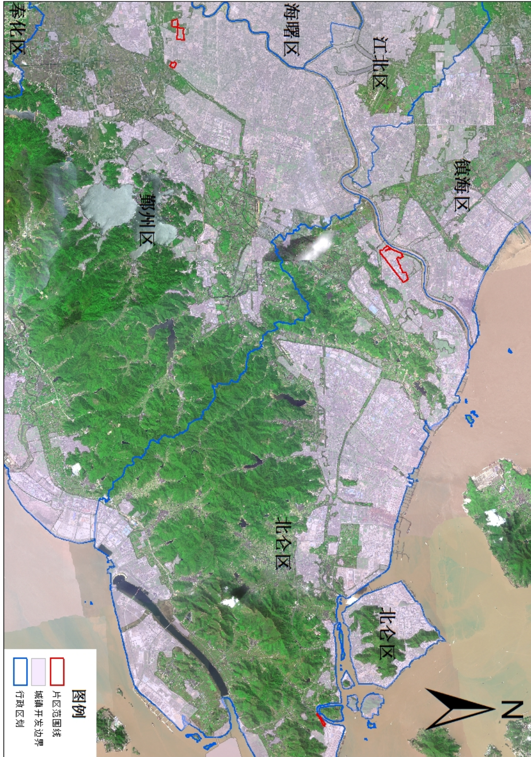
成片开发片区范围示意图